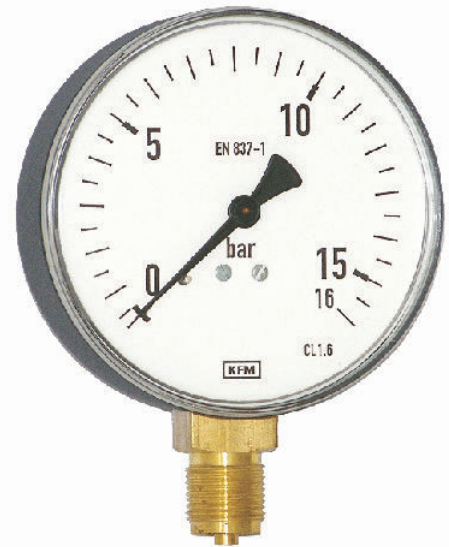
Manometr model 111.20